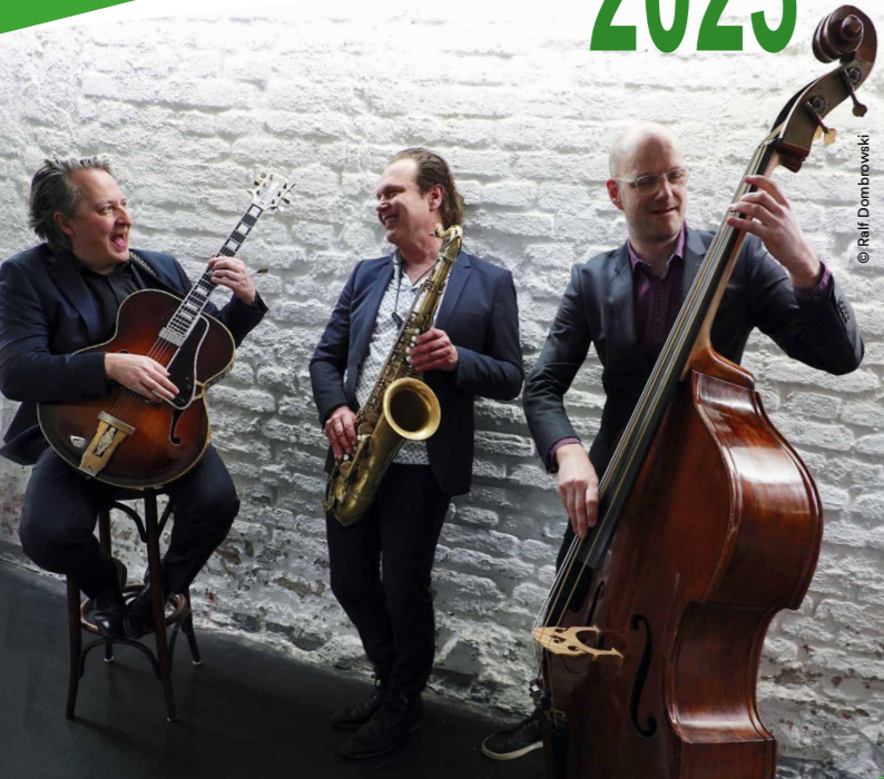
Mulo Francel Trio Nr. F05